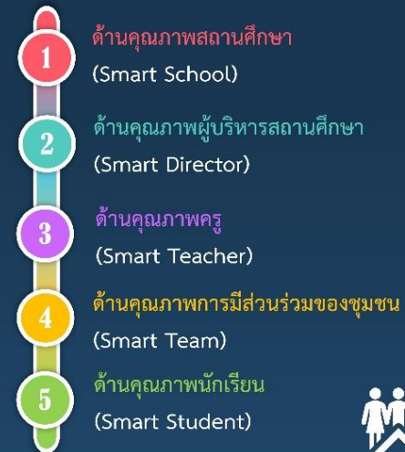
ภาพที่ 1 รูปแบบการบริหารสถานศึกษาสู่ความเป็นเลิศของโรงเรียนบ้านปะหละ สำนักงานเขตพื้นที่การศึกษาประถมศึกษาศรีสะเกษ เขต 2